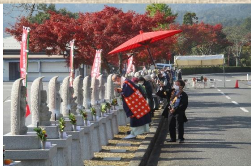
霊場お砂踏み巡拝法要